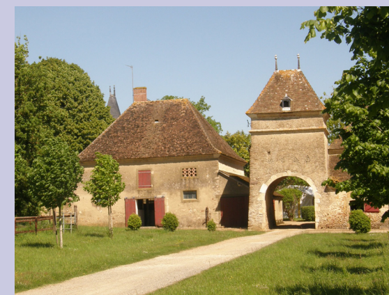
château de Chères et son pigeonnier

En chemin je respecte la charte du randonneur